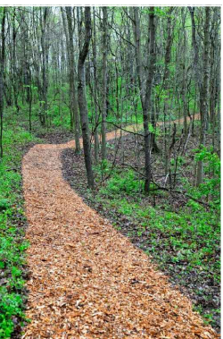
ösvény faapírtékkal, szegély nélkül