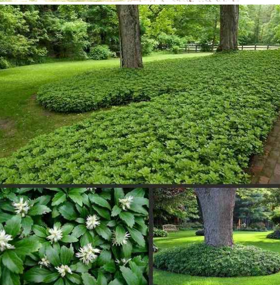
árnyéki aljnövényzet jellegű ágyások